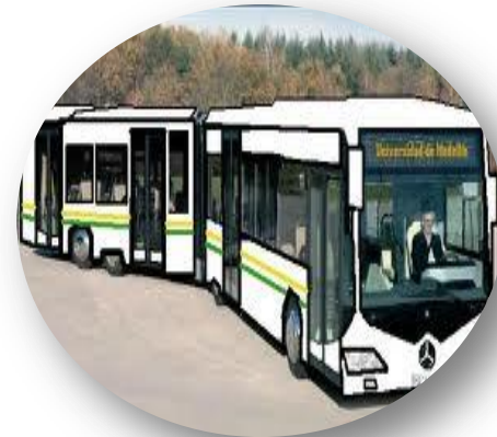
Línea 1 de Buses