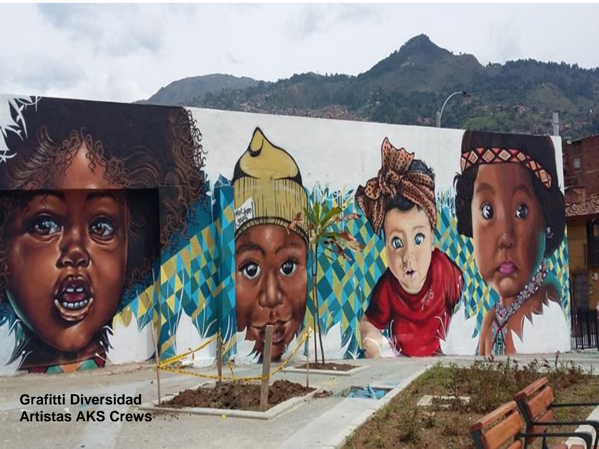
Graffiti Diversidad Artistas AKS Crews